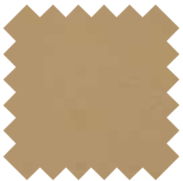
Bois de santal