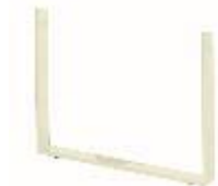
Blanc (ral 9010)