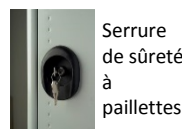
Serrure de sûreté à paillettes