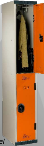
Visual non contractuel