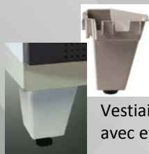
Vestiaires disponibles avec et sans pied

Le procédé de profilage agrafage Seamline® renforce la résistance des montants, équivalent à une tôle ép. 10/10 ème pliée.