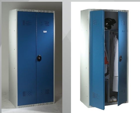
(Visuels non contractuels)