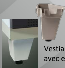
Vestiaires disponibles avec et sans pied