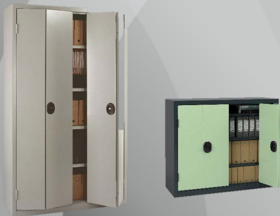
Armoires prof. 430 mm

Une gamme complète d'armoires monoblocs alliant esthétique, fonctionnalité, robustesse, ergonomie pour vous apporter des solutions variées et répondre ainsi à vos exigences.