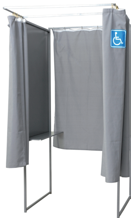
Utilisation seule ou en batterie